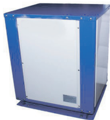
Warmtepomp tot 80 graden voor radiatorverwarming/ luchtverwarming/ vloerverwarming.